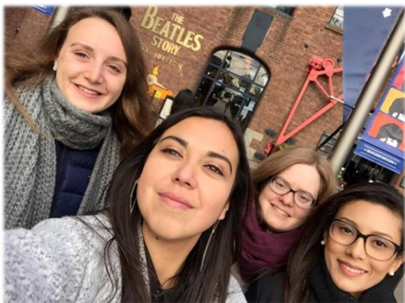
Voyage à Liverpool avec d'autres volontaires

C'était très enrichissant et intéressant de découvrir les différentes cultures et façons de vivre de chacun.