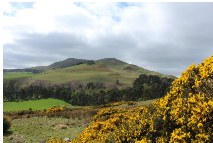
Visite de l'Ecosse