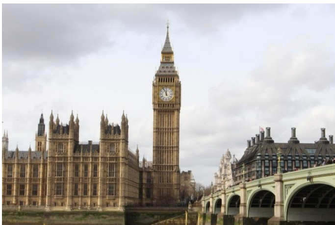
Visite de Londres

Chaque volontaire a droit à des congés. En ce qui me concerne, j'ai eu la chance de bénéficier des vacances scolaires, ce qui m'a donné beaucoup de temps libre pour visiter le Royaume-Uni.